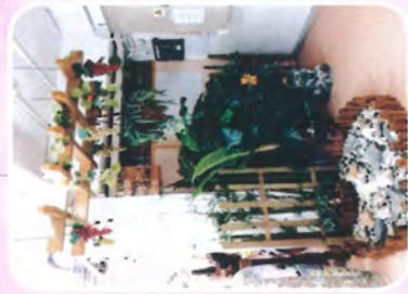
▲ 石山花園 心曠神怡