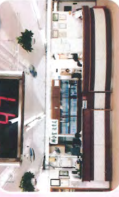
▲ 開放式辦公室有電子呼喚系統