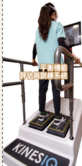
平衡機能評估與訓練系統