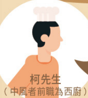
柯先生 (中風者前職為西廚)

「這裡的訓練儀器比醫院更多，我的康復進度快了很多，很開心能夠見到自己的進步。我有信心康復後能再做廚師！」