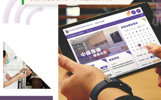
單人房 智能操控版面