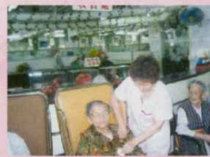
▲ 為長者進行個人護理

我們有註冊西醫定期為院友免費巡診，保健員、護理員24小時照顧長者的起居和護理；沐浴、洗頭、洗衣、理髮、剃鬚、剪甲、餵食、換片、量度血壓、體溫、脈膊、呼吸、驗血糖、清洗傷口、換尿喉、換胃喉、注射胰島素針...等等。